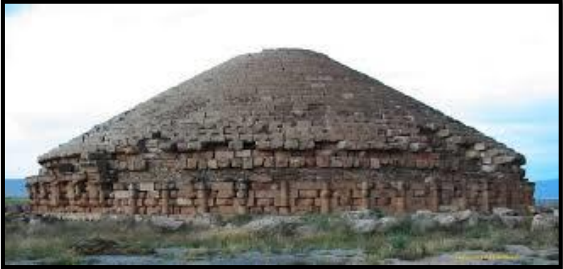
صورة توضح ضريح مدغاسن بباتنة

اشرفا على بناءه و يسندون في ذلك الى كون يوبا الثاني كان رجلا مثقفا و ذو ذوق رفيع من خلال رحلاته التي قام بها - ضريح الخروب : يسمى ايضا بضريح ماسنيسا يقع فوق هضبة بالقرب من مدينة الخروب بمدينة قسنطينة ، يختلف هذا القبر بكونه مشيد بالاحجار المصقولة و ذو شكل مكعب قي قاعدته مع درعين اللذين يرمزان لرتبة الملك الامازيغ. و كخلاصة نجد ان الظروف الطبيعية الملائمة الى جانب الاستقرار السياسي و التقدم الزراعي و تزايد السكان ساهمت في ازدهار الحياة الاقتصادية و التخطيط العمراني للمدن و العناية بالمدافن من خلال اقامة الاضرحة و القبور.